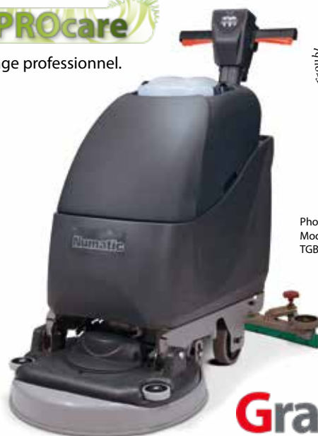
Photo d'illustration Modèle présenté TGB4055

Troubles musculo-squelettiques Réduction TMS